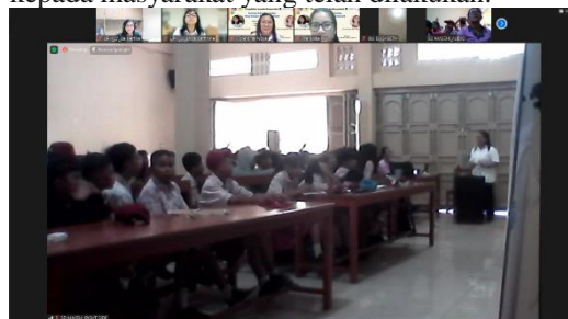
Gambar 1. Dokumentasi peserta melakukan pre-test

Berikut beberapa dokumentasi kegiatan pengabdian kepada masyarakat yang telah dilakukan: