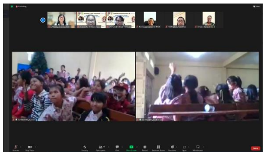
Gambar 3. Dokumentasi post-test