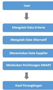
Gambar 1. Use case diagram

Hasil pengolahan data menunj-kan bahwa supplier pada posisi pertama ialah S1 memiliki skor tertinggi yang identik, yakni 0. 90. Artinya, supplier tersebut secara keseluruhan memiliki kinerja terbaik dan dapat diprioritaskan dalam proses pengadaan. Pembahasan adalah penjelasan dasar, hubungan dan generalisasi yang ditunjukkan oleh hasil. Uraiannya menjawab pertanyaan penelitian. Jika ada hasil yang meragukan maka tampilkan secara objektif.